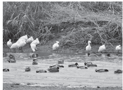
多々良川河口に飛来した冬の使者 クロツラヘラサギ

次年度も福岡県内の湿地保全や動物愛護に関する活動を継続し、その他の公害・環境問題についても調査、研究を行っていきます。